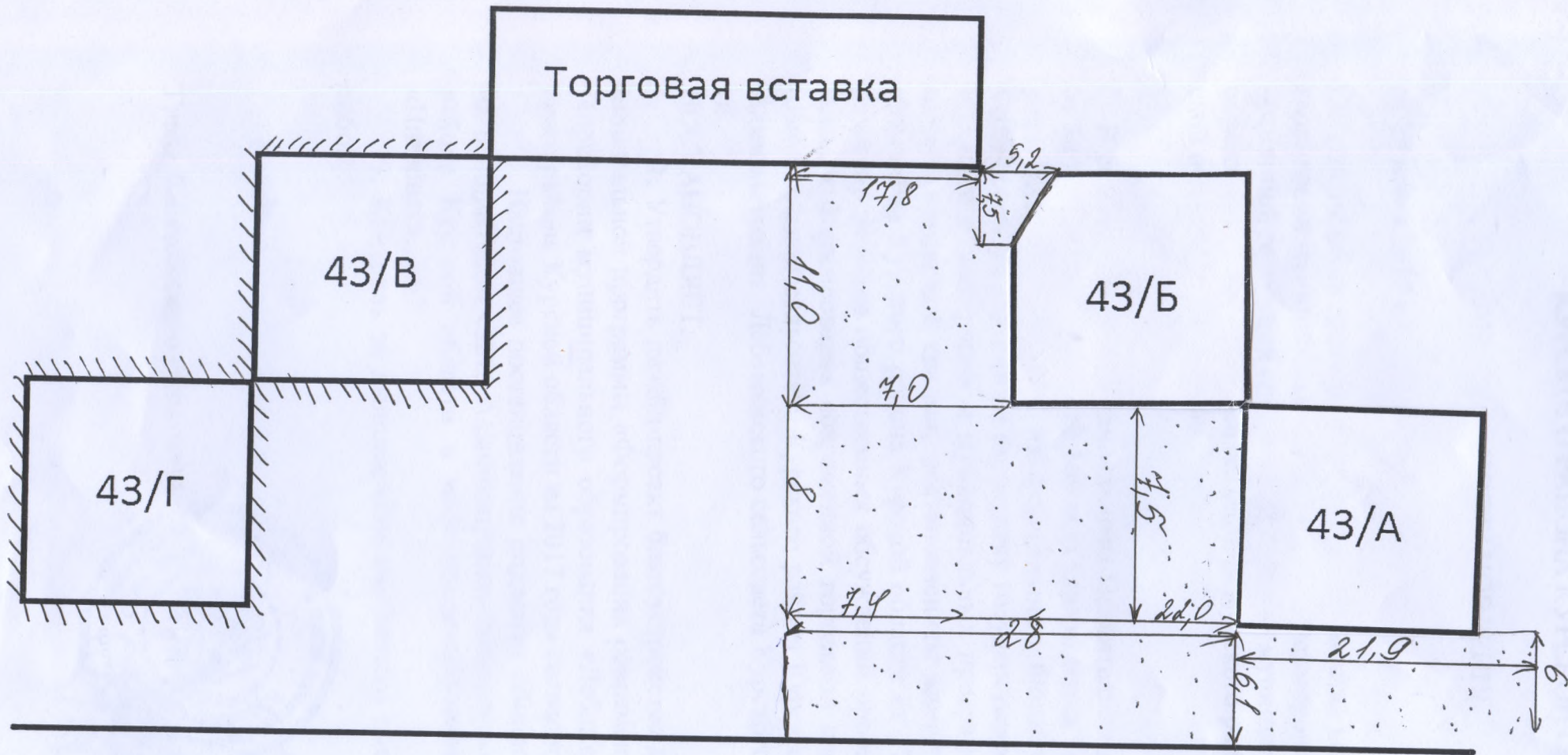
Схема № 1