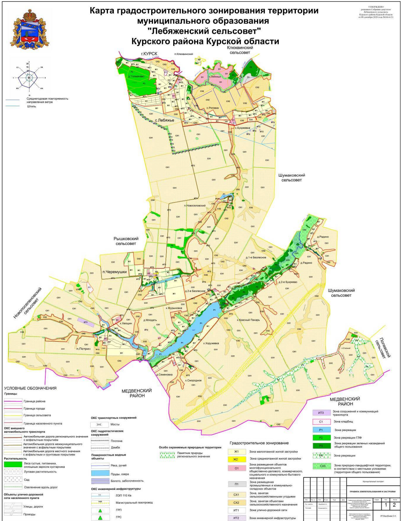
Рис.1. Карта градостроительного зонирования территории муниципального образования «Лебяженский сельсовет» Курского района Курской области